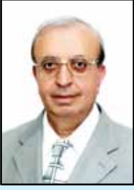
بقلم: أ. د يوسف مونات

غالباً ما تفرق المصالح المادية المتعارضة بين الاصدقاء فيتحول الأصدقاء إلى خصوم . وللحقيقة فإن المصالح المادية قد تقرب أو تفرق بين المعارف وليس بين الأصدقاء ، لأن الصداقة هي مشاعر إنسانية نبيلة تنم عن الصدق والوفاء بين قلوب مفعمة بالمحبة وعقول مكنزة بالحكمة . ولذا فقد نتفياً ظلال شجرة الصدق سواء حملت ثمار المنافع المادية او لم تحملها ، لأن المنافع المادية هي ثمار الصداقة وليست جذورها . فالصداقة هي كالورود الجميلة التي تسر العيون بجمالها وتنعش النفوس بأريجها دون أن تشبع البطون .