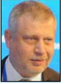
بقلم م. اميل الغوري