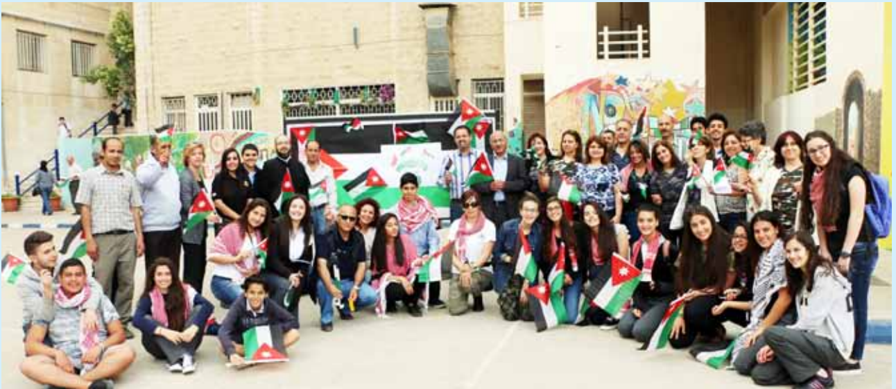
من احتفالات مدارسنا بالأعياد الوطنية

وفي أيارَ، وكتقليدِ سنوي، كرمت جمعية الثقافة