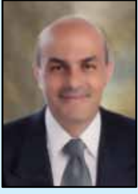
بقلم الأستاذ سالم نجمة

والتعليمِ الأرثوذكسيّةِ في الثامنِ والعشرينِ منه فرسانها في حفلٍ سنويٍّ عرفاناً بجهودهم الخيرة وعملهم الدؤوب في هذا الصرح الكبير على مرّ السنوات الطوال.