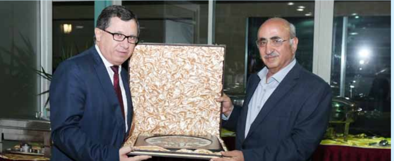
رئيس الهيئة الادارية يقدم درعاً تكريماً لمدير مدرسة الشميساني