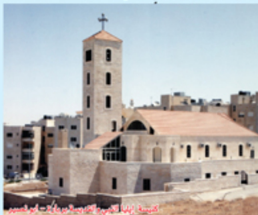
كنيسة ابناء الكنيسة القديسة جورج في أبو نصير

بعد شراء الأرض قمت بعمل المخططات الهندسية الكاملة والتي شملت بناء كنيسة وقاعة للشبيبة ومدارس الأحد ومنزلاً للكاهن بمساحة اجمالية تقدر بحوالي ١١٠٠ متر مربع. بتاريخ ٢٠٠٥/٩/١٠ بدأنا العمل بحفر الأساسات. وقد واجهنا مشكلة وجود تربة رملية ضعيفة معاً استعملنا التزول بالحفر إلى عمائة أمتار عن مستوى