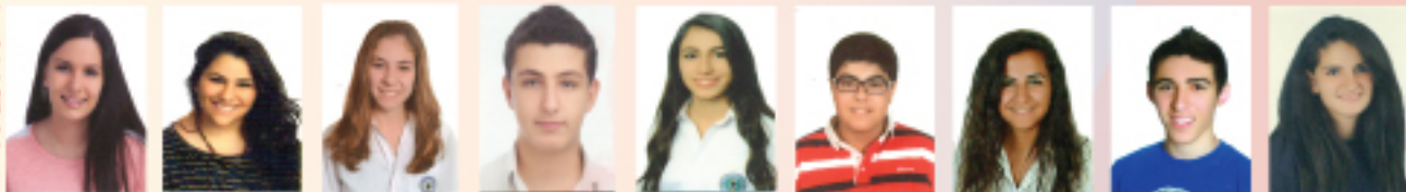
أمل-ماريا سايا هادي وكيلة لارا حداد قسي بقاعين سارة حتر فؤاد هلسة نهن نجار إيميلي حمارلة ديبالا فالحوري