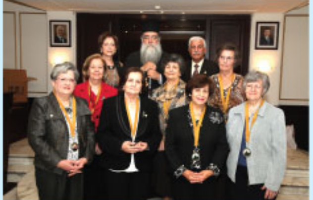
السيدات المكرمات مع الرئيس والمطران ومقرر اللجنة