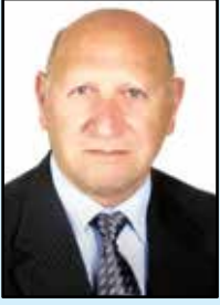
الدكتور جورج طريف

وبعد عدوان الخامس من حزيران ١٩٦٧ أدت الجهود الدبلوماسية الأردنية بقيادة الراحل الكبير، إلى استصدار القرار الأممي رقم ٢٤٢ في تشرين الثاني من العام ١٩٦٧، واشتمل على معادلة انسحاب شامل مقابل سلام شامل والاعتراف بحق الجميع في العيش بسلام في المنطقة.