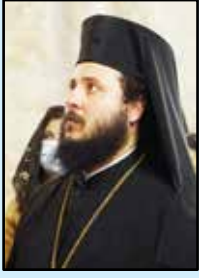
قدس الأرشمندريت خريستوفورس حداد

ومن هنا ندرك أن مواكبة الكنيسة للعصر لا تتحقق عبر المساس بقداستها ومفاهيمها اللاهوتية وإنما بالحفاظ عليها من خلال الحفاظ على شعبيها المؤمن من الانغماس بروح العصر