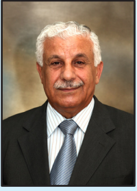
إعداد: الياس شفيق نينو

ما عدا الخبيثة وقد اتحد باقنومه اتحادًا لا اختلاط فيه ولا تغيير ولا تقسيم دون أن يحول طبيعة لاهوته إلى جوهر جسده ولا جوهر جسده إلى طبيعة لاهوته