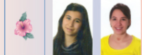
ساليا شيودوري سوار يمون مارييا فركوح