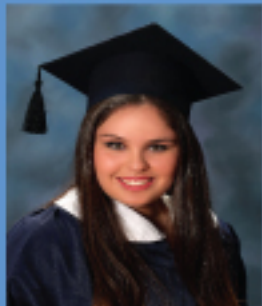
كرم جمال الحرامي ٩٠,٠