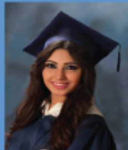
سبل فايز حتر ٩٠,٠