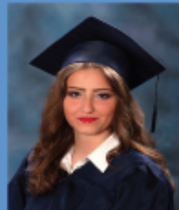
زيننا مازن هلسه ٩٠,٠