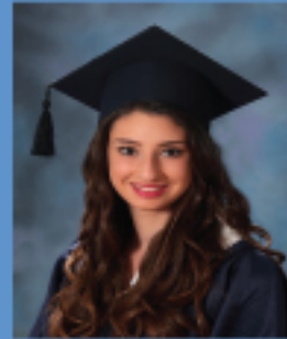
بانا جابي بطشون ٩٦,٥