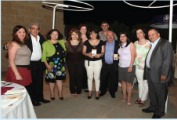
صورة جماعية مع الكريمة ( القسم ١٠-١٢ )