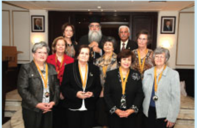
السيدات المكرمات مع الرئيس والمطران ومقرر اللجنة