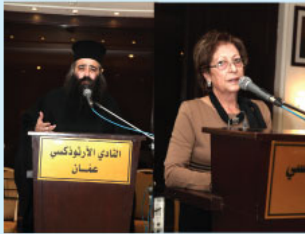
قدس الارشمندريت نكتاريوس