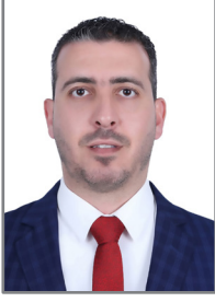
إعداد: عيسى يوسف حداد

والأطفال والعائلات من خلال الأنشطة المختلفة والحفلات والمسابقات التي تدرج تحت (كُلنا واحد بالمسيح)، وتسويق وجهات نظرهم التي لطالما