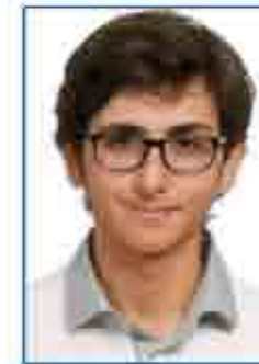
مجد مئري منى A٤-A٢