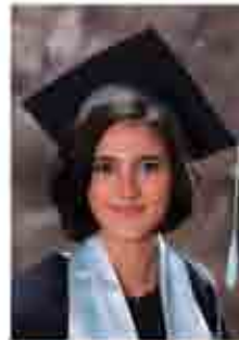
رمز ياسل قتالة ٨٨.١٪