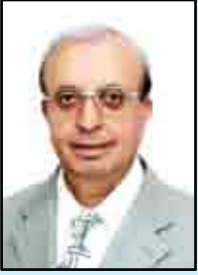
الأستاذ الدكتور يوسف مسانت

وتقبل المعلومة بشوق تمهيداً لتحويلها إلى معرفة نافعة تسهم في استكمال الهيكل المعرفي لدى الطالب فهماً وتحليلاً وتطبيقاً لا بد من توفر العناصر الآتية في الحصة المدرسية: