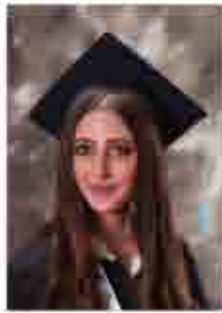
هنا جورج قموه ٨٨.٨٪

يهنئ رئيس وأعضاء الهيئة الادارية جمعية الثقافة والتعليم الأرثوذكسية أبناءهم طلبة المدرسة الوطنية الأرثوذكسية-الشميساني قسم البرامج الأجنبية على النتائج المشرفة التي أحرزوها في امتحان شهادة الثقافة العامة البريطانية لعام ٢٠١٦ الحاصلين على معدل ٨٠٪ فما فوق والتحقوا بالجامعات وبالتخصصات التي اختاروها