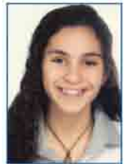
راقايلا سامر كرادشة *A٧