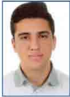
سند فراس رقطان A١ - *A٥