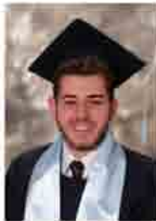
سند رائد زنيقة ٨٨.٩٪