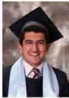
لبث منهل نفاع ٨٨.٨٪