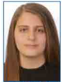
جوتلي اميل الديك A٤ - *A٢