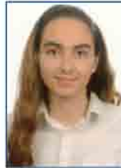
سيقانه سمعان دبور A٥

هنيئاً لإدارة المدرسة الوطنية الأرثوذكسية ومعلميها على هذه النتائج المتميزة، وهنيئاً لطلبتنا المتفوقين ولأولياء الأمور الكرام مثنين جهودهم المباركة وتعاونهم المستمر وعهداً أن تظل المدرسة رافداً للمتميزين من أبناء أردننا الغالي.