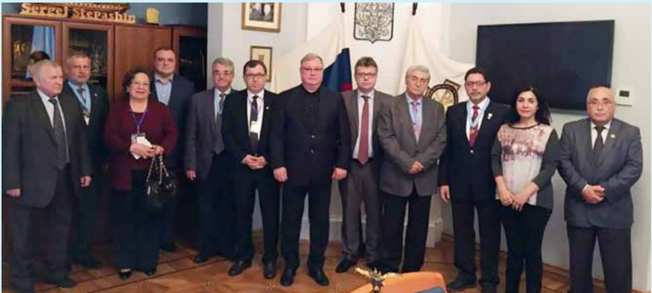
صورة جماعية مع سيرجي إستباشن رئيس الجمعية الامبراطورية الفلسطينية الأرثوذكسية/ موسكو

وقد أبدى السيد إستيانشن إهتمامه بفتح جامعة أردنية روسية في الأردن بعد الحصول على المباركة من جلالة الملك عبدالله الثاني بن الحسين والرئيس الروسي فلاديمير بوتن.